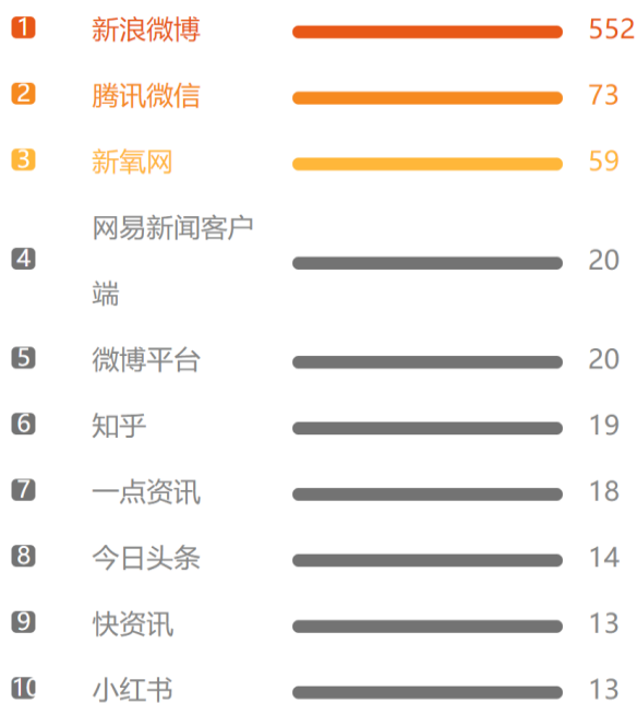
负面所在网站排名