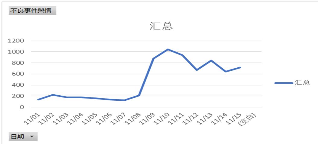
不良事件发生时间分布